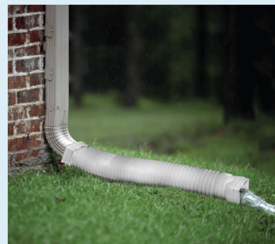
Branchement à 1,5 mètre du bâtiment