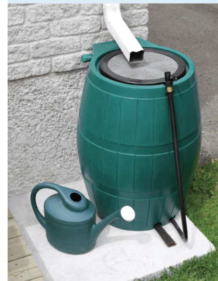
Baril récupérateur d'eau de pluie