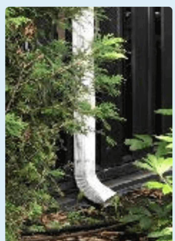
Branchement à moins de 1,5 du bâtiment