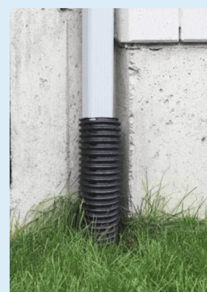
Branchement au drain français